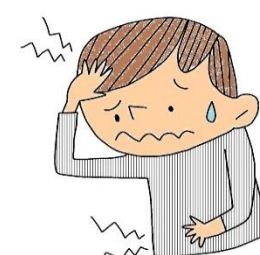
痛いところがある (頭やおなかなど)