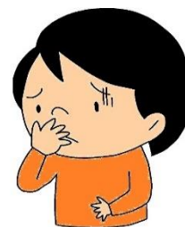
気分が悪くなった はきそう