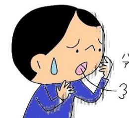
なやんでいることがある