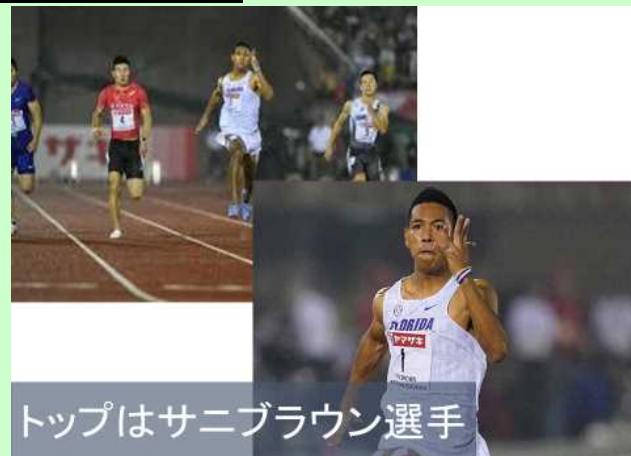
トップはサニブラウン選手

ところで、6月28日に福岡の「博多の森競技場」で行われた陸上日本選手権大会をニュースなどで見た人もいると思います。男子100mで見事優勝したのが、福岡県出身、20歳の日本記録をもっているサニブラウン選手でした。16歳で世界陸上の準決勝まで進出した才能あふれる選手です。